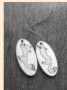
▲ごんぎつねストラップ