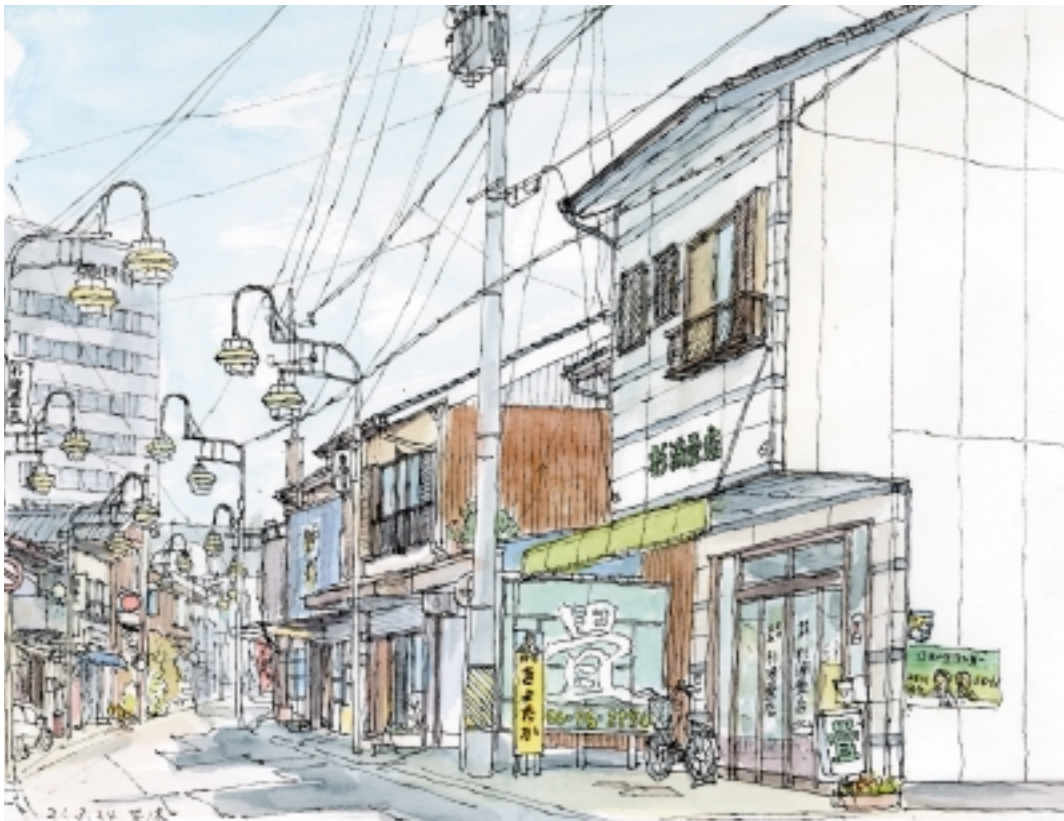
安城スケッチの街並その5 花ノ木町