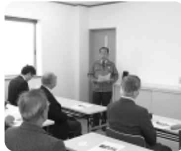
▲フジイ化工(株)視察

ックの切断・粉砕・リペット・梱包の各工程を実際に見学した。また、地域貢献活動と環境対策に力を入れており、三河エリアの小中学校・各種団体が回収したペットボトルの蓋をリサイクルするエコキャップ運動や省エネ対策などの説明を受けた。