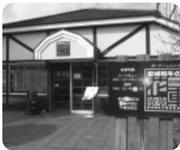
▲安城和牛の店「花車」

今回ご紹介する事業所は安城産業文化公園デンパーク内にある、安城和牛の「花車」やフローラルプレイス内の「デキタツテ・トレタツテ工房」・マーガレットハウス内「バーンパーティー」を経営する株ネクスト。デンパークの人気商品ソーセージはフローラルプレイス内にある工房で作られ、販売するソーセージ・ハムはなんと30種類！もちろん安城産の豚肉を使用しています。「花車」ではこの手作りソーセージの食べ放題（大人1,500円）が大盛況とのこと。（土・日限定。※貸切の日は中止）ここでは安城和牛を使った焼肉やハンバーグも