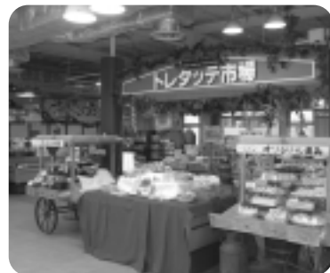
▲フローラルプレイス内