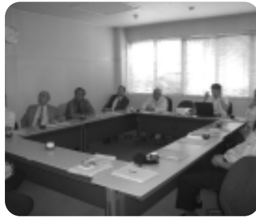
▲データライン(株)視察

説明後は、実際に工場内を見学し、同マーク取得後の工場内の変化等について説明を受けた。同社は、印刷会社としてDM等の個人情報を取り扱うにあたり、同マーク取得による個人情報管理を徹底し、信頼と利益向上に繋げる仕組みづくりを目指している。