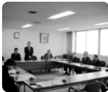
▲沼津商工会議所での懇談

その後、沼津港の沼津みなと商店会と保冷剤の生産シェア第1位の(株)トライカンパニーの視察を行い、保冷剤のリサイクル・リユースについての取り組み等について説明を受け、工場内を見学した。