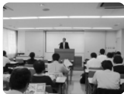
▲中森氏による「税の話し」

安城商工会議所 電話76-5175 E-mail: info@anjo-cci.or.jp