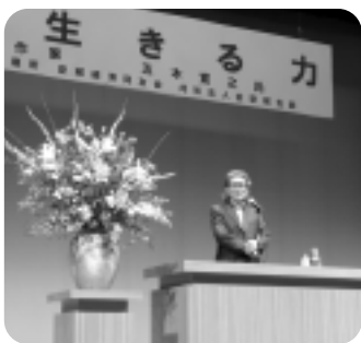
▲作家の五木寛之氏

当日は人気作家の五木寛之氏を講師に迎え、「今を生きる力」と題した講演に会場は約500名の聴衆で満員となった。先着100名の来場者に対し講師より著書「私訳敦異抄」のプレゼントがあった。