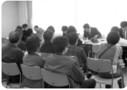
▲相談を聞く指導員ら

当日の相談会では、税理士や青色申告会役員、当所経営指導員らが訪れた多くの皆さんの年末調整事務について相談・受付を行った。