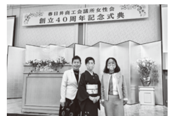
春日井商工会議所女性会40周年記念式典