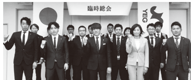
令和4年度役員予定者