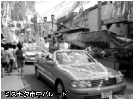
ミス七夕市中パレード