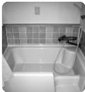
▲子供用の設備も完備で安心