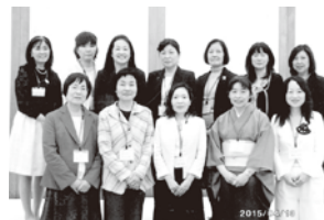
▲27年度 総務・広報委員会 メンバー