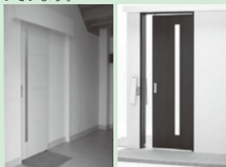
▲マット式 「エコ自動ドア」 ▲操作盤式 「あっくんです!」

同社では、企業、工場、一般家庭、病院、デイケアセンター、倉庫など、幅広くご紹介いただける代理店様を募集! 環境首都・安城で生まれた、エコな工業製品を全国に発信しませんか?