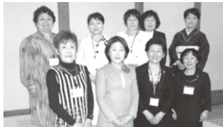
▲創立20周年 実行委員会 メンバー