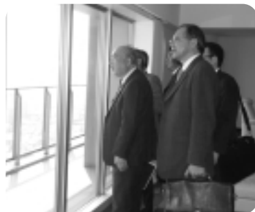
▲名鉄不動産(株)視察

その他、快適でハイクラスな都市生活を実現する洗練されたパブリックスペースを見学し、住宅に関する需要の変化などについて理解を深めた。