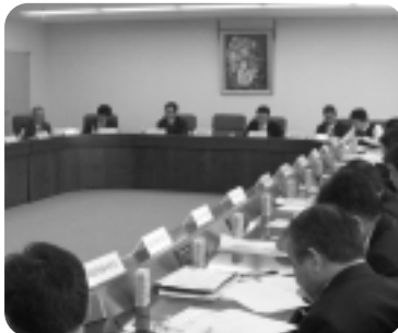
▲融資実務者懇談会

当所金融部会は平成21年度融資実務者懇談会を開催した。市内の金融機関各支店の担当者には会員企業の金融支援を円滑に進めていただくため、安城市商工課・日本政策金融公庫・愛知県信用保証協会・当所金融担当がそれぞれの融資制度について説明し、協力をお願いした。