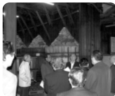
▲(株)まるや八丁味噌 視察

他の部会・委員会も順次開催され、その審議内容は3月の正副会頭会議、常議員会、通常議員総会で提案される。