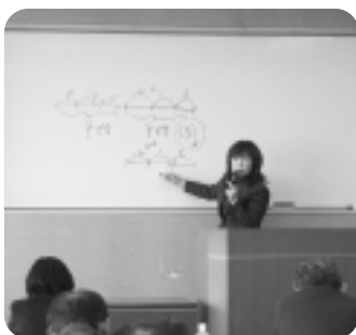
▲雇用安定助成金説明会