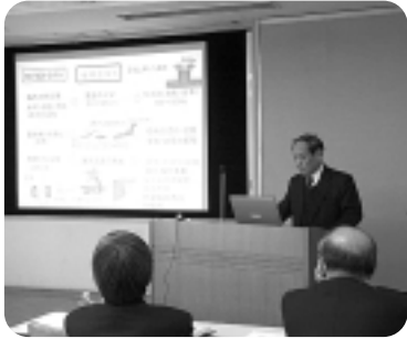
▲エコアクション21の活用法講座