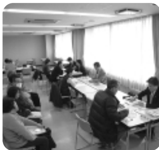
▲青色決算・申告個別相談会

当所委託税理士・経営指導員・青色申告会役員が、個人事業者の青色決算書・申告書の書き方や計算方法について個別に相談を受けた。