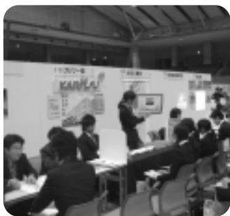
▲西三河で就職！合同企業説明会

当所は西三河地区の商工会議所・雇用対策協議会等11団体と共催でウイングアリーナ刈谷にて合同企業説明会を開催した。当日は、西三河地区の企業12社の参加があった。来場者は平成22年春卒業予定の学生を中心に、男性342名、女性404名で、企業の人事担当者の説明を熱心に聞いていた。