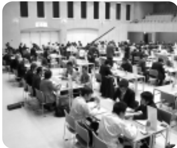
▲三河・知多地域商談会

発注企業54社、受注企業198社の参加があり、個別商談を行った。昨年に比べ受注企業の参加数が増加した。