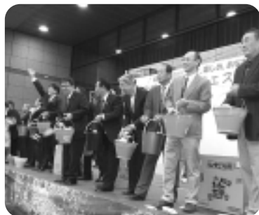
▲昨年のエンディングセレモニー・もち投げ