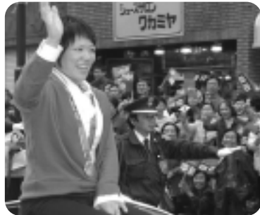
▲平成16年の谷本歩美選手凱旋パレード

■トン汁無料提供500人分 ■姉妹友好都市展 ■安城発掘探検隊 ■献眼献腎骨髄移植ドナー登録