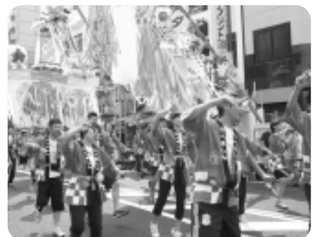
▲DanSpo ANJO ダンスパレード