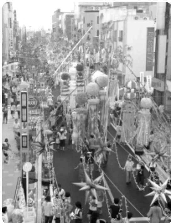
▲JR安城駅デッキからの眺め