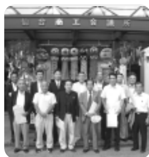
▲仙台商工会議所にて

翌日、多賀城市にあるセライス㈹を視察。セラチンの製造工程の説明を受け、工場内を見学し、再度まつり会場に戻り仙台七夕まつりを散策し研修会を終えた。