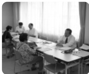
▲源泉納付個別指導会