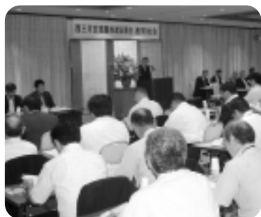
▲西三河交流圏推進協議会総会