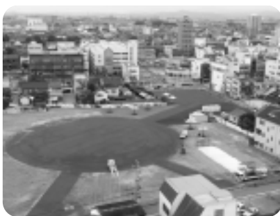
▲早期整備が待たれる交流広場

今後とも早期整備に向け、更生病院跡地周辺区域の土地区画整理事業と合わせて中心市街地拠点整備に取り組んでいく。