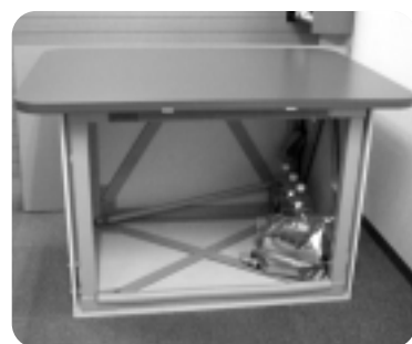
▲大好評のミニシェルター

不安を取り除くことが同社の目標なのです。事情があつても耐震改修工事やお部屋のシェルター化が出来ない方には、「ミニシェルター」がオススメ。愛知県産業技術研究所において10tの加重にも全く変形しないことが証明された優れ物です。東海地震・東南海地震が発生すると震度6強程度の揺れが生じると予想されています。「備えあれば憂い無し」まずはご相談してみたいかがですか？建築設計のプロがどんな小さな要望にも全力で応えます！