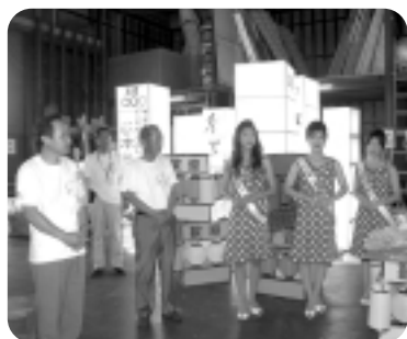
▲激励の挨拶をする親善大使

石川会頭・神谷市長・七夕親善大使は、七夕まつりの準備をする商店街の人々を訪問した。