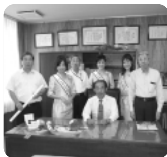
▲安城七夕親善大使が来所

安城七夕親善大使の3名が正副会頭を表敬訪問した。親善大使らは七夕まじりのキャンペーン活動や、まつり当日のイベントなどについて話した。