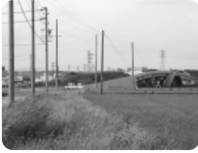
▲完成が待たれる豊田安城線