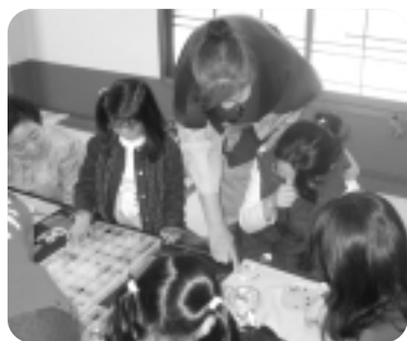
▲前回のまちの教室