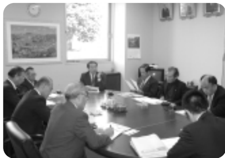
▲鳥羽商工会議所での懇談会