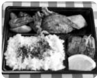
▲大人気のハンバーグ弁当

今回は住吉町の「ピフロンテ」に伺いました。昼は手作り弁当の販売、夜はイタリアンレストランバーという二つの顔を持ったお店です。 お昼の一番人気のお弁当はハンバーグ弁当。大きなハンバーグがとっても好評です。豚しょうが焼き弁当も人気のお弁当。どちらも価格は500円とお手ごろ価格も嬉しいですね。他にも9種類の弁当があり、どれにしようか迷ってしまいそう。 店内で食べることもできますし、お持ち帰りして公園やオフィスで食べるランチもいいですね。また、10個以上の注文で配達の手配もありません。