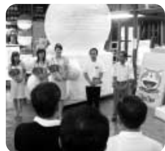
▲激励する石原会頭

石原会頭、神谷市長、ミス七夕3名は、8月4日から開催される「第53回安城七夕まつり」の竹飾り作成現場（日通倉庫）を訪れ、来客者を喜ばせようと工