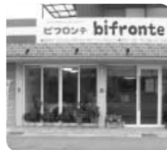
▲イタリアンカラーの看板が目印