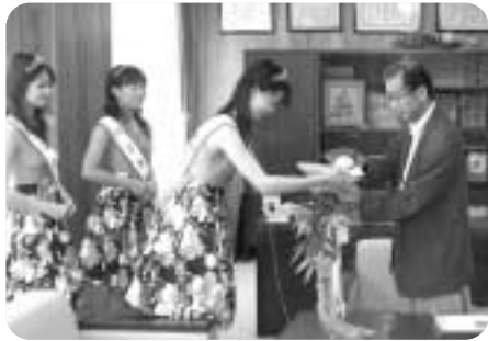
▲ミス七夕からポスター等を授与