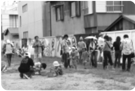
▲市民・学校・地域・行政などが一体となって 取り組んだ「交流広場ウォールペイント事業」