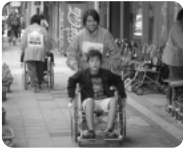
▲「こんなまちだったらいいね」を実験的に 行う実践の日「サンクスフェスティバル」