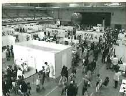
▲EXPO ANJO 2019 開催風景 (来場者数2日間 合計21,000名)