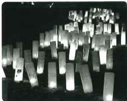
▲願いごとキャンドル