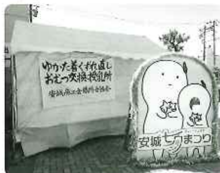
▲ゆかた着崩れ直し、おむつ交換、授乳所