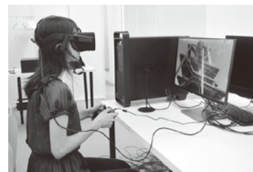
▲VRによるプラント設計の検討